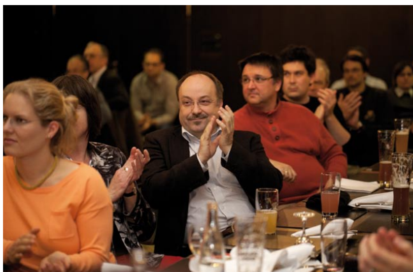
Die Preisverleihung fand im Eden Hotel Wolff, München, vor fachkundigem Publikum der GI-Regionalgruppe statt.